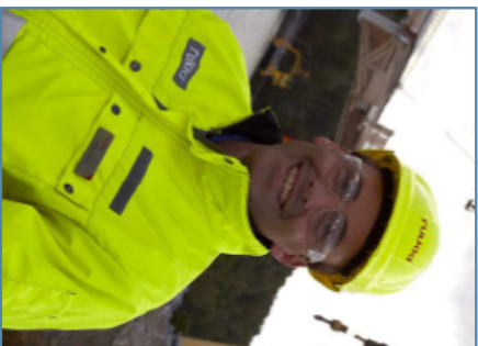
Anders Spåls Trafikverket