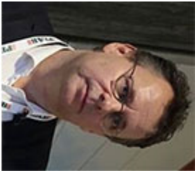
Urban Alm PEAB